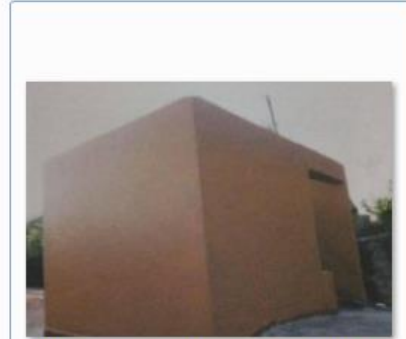
Base del tinaco de la Escuela 17DJN0001F del Después

Para el caso exclusivo de las fotos todas las fotografías deberán ser en archivo digital. NO se admiten archivos en formatos WORD o EXCEL ni PDF (solo JPG) debiendo asignar el nombre a su archivo relacionado con la acción que se realizó.