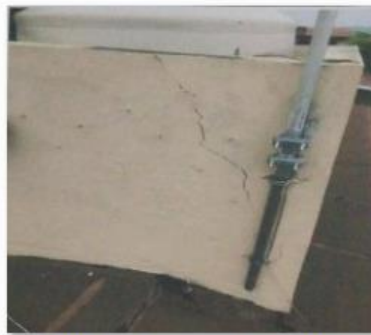
Base del Tinaco de la Escuela 17DJN0001F del Antes

En las fotografías, deberán especificar en el nombre de la foto la clave del centro de trabajo y la acción que realizó para identificar su antes y después , ejemplo: