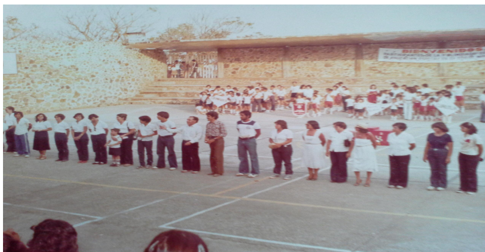
Personal de Educación Especial