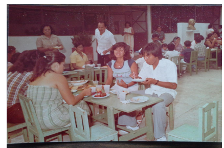
Personal de Educación Especial En las instalaciones del Jardín de niños Simón Bolívar en Cuernavaca.

Se ha realizado mucho trabajo y se continúa picando piedra. A partir del 2006 queda establecida la lengua de señas mexicana como tal, pero aún hace falta seguir trabajando mucho y sobre todo darle la importancia que tiene. Ahora toca a los compañeros sordos que trabajan en Educación Especial, toca impulsar la educación bilingüe porque ellos ya están formados en esta parte de la pedagogía (algunos), ya que lo viven día a día.