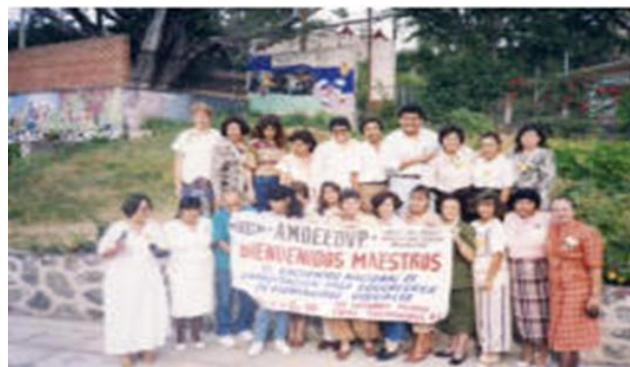
En la década de los ochentas Cuernavaca fue sede de cursos de capacitación a nivel nacional, para docentes de educación especial. En la imagen se muestra a los anfitriones.