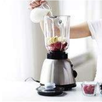
Hacer un licuado