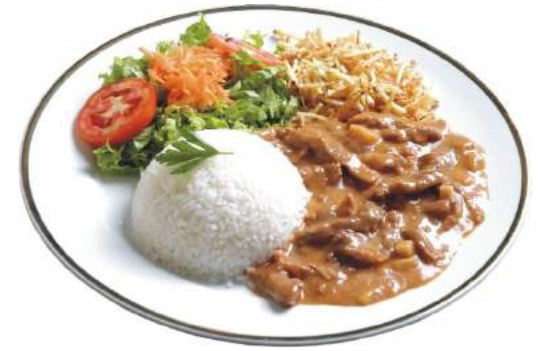
Servir la Comida