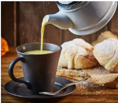
Servir y tomar una bebida caliente