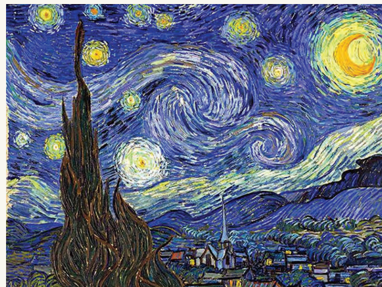
Noche estrellada. Vicent van Gogh (1853-1890) nació en Zundert, Países Bajos. Es considerado como un representante del expresionismo.

Esta obra personaliza el gusto por lo nocturno. En ella se muestra la vista exterior del sanatorio de Saint-Rémy-de-Provence, Francia, donde el autor se recluyó hacia el final de su vida. Aunque la obra es una representación del paisaje nocturno del lugar, visto desde la ventana del cuarto de Van Gogh, fue pintada durante el día, de memoria. En ese periodo de reclusión, la representación de remolinos identifica las pinturas del autor, como en ésta que es una de sus grandes obras; lo que algunos consideran que es el reflejo de su condición siquiátrica.