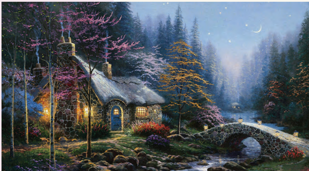
Casita de campo, crepúsculo, Thomas Kinkadee (1958-2012) nació en Sacramento, California, EUA.