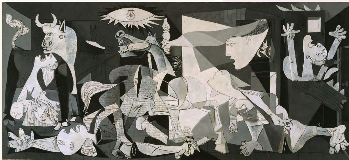
El Guernica , Pablo Picasso (1881-1973) nació en Málaga, España.